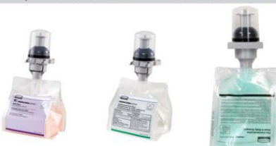
Gel, boquilla negra

Gel hidratante. Enriquecido con manteca de karité y vitamina E. Hipoalergénico para pieles sensibles. Gel antibacteriano. Elimina más del 99,99% de los gérmenes en 15 segundos. Cumple con las normas NSF y EN1499. Gel champú. Con manteca de karité, vitamina E y acondicionadores para un pelo suave y sedoso. Hipoalergénica.