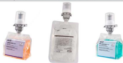
Espuma, boquilla blanca

JABÓN EN ESPUMA para el lavado de las manos