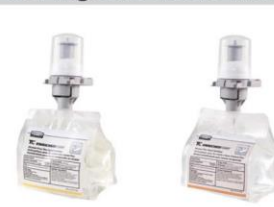
Espuma, boquilla blanca

ESPUMA HIGIENIZADORA para la higiene de las manos